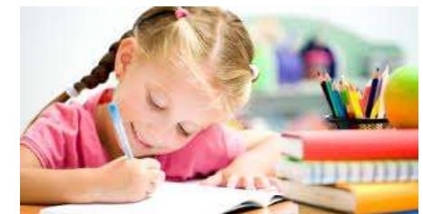
ESECUZIONE DI COMPITI